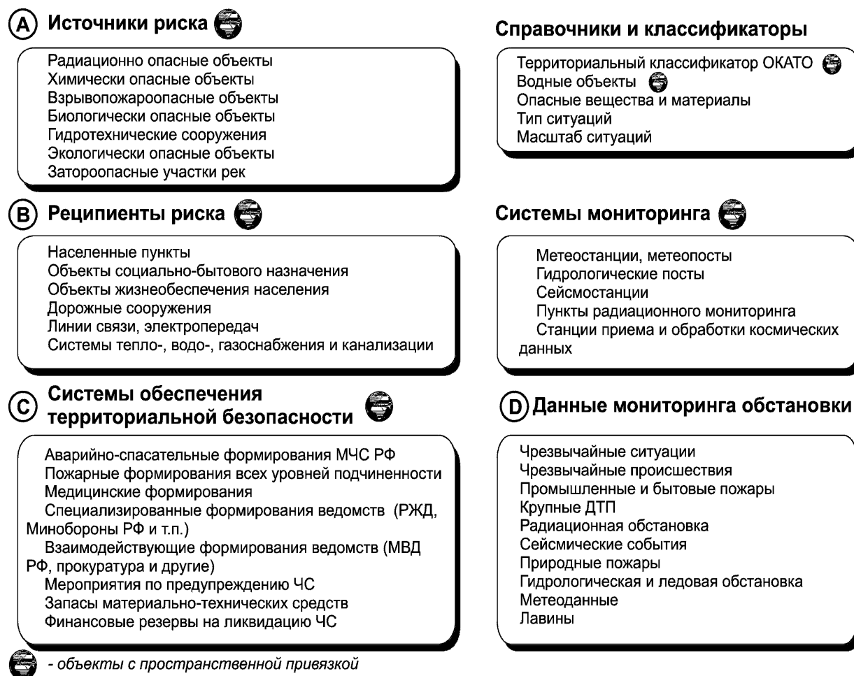
Рис. 1. Схема кризисных баз данных